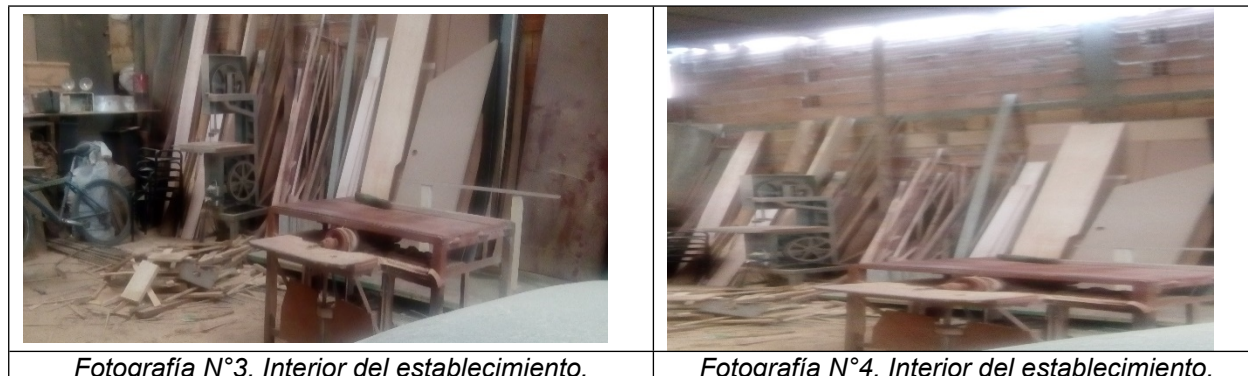
Fotografía N°3. Interior del establecimiento.